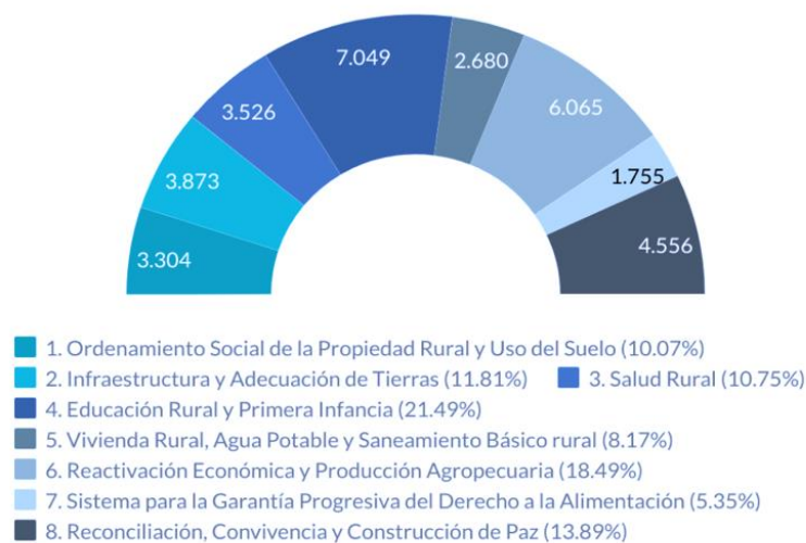
Gráfica 1 Número de Iniciativas por Pilar