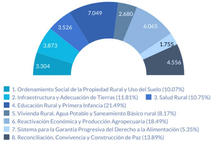
Gráfica 1 Número de Iniciativas por Pilar